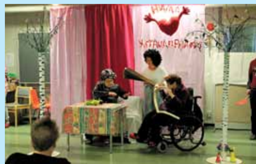
Työpaja Telakan näytelmäkerho tekee esityksiä myös tilauksesta.