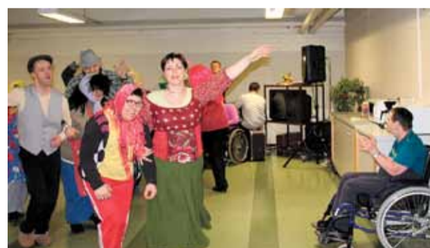
Yhdessä olemme enemmän – kulttuurit kohtaavat.

Työpaja Telakalla valmistetaan käsitöitä myös tilauksesta.