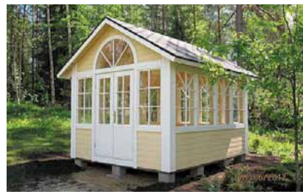
Savonlinnan kaupungin nuorisoverstaan taidonnäyte.

Etsivän nuorisotyön teh- tävänä on tavoittaa tuen tar- peessa oleva 15–29-vuotias nuori ja auttaa häntä sellai- sen palvelujen ja muun tuen piiriin, joilla edistetään hän- nen kasvuaan, itsenäistymis- tään, osallisuuttaan yhteis- kuntaan ja muuta elämän- hallintaa, sekä pääsyä kou-