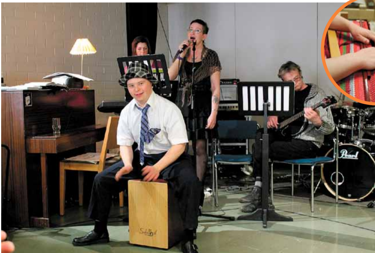
Työpaja Telakalla musisointi on työtä ja yhdessä soittaminen yhdistää eri asiakasryhmiä.

Musiikki on isossa roolissa työpajatoiminnassa. Työpajalla on oma bändiluokka, jossa harjoitellaan päivittäin. Suositua on myös joka perjantaina pidettävä karaoke.