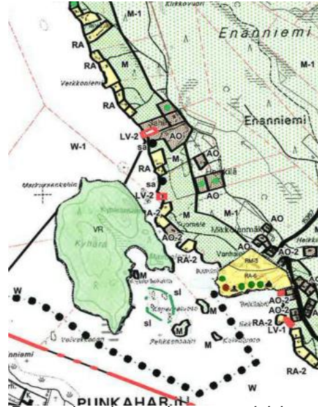
Puruveden ajantasainen rantayleiskaava 2017

Voimassa olevissa rantakaavoissa, jotka on vahvistettu 22.9.1972 ja 8.10.1979 alue on sairaaloiden ja muiden sosiaalista toimintaa palvelevien rakennusten aluetta (YS) sekä maa- ja metsätalousaluetta (M), puistoaluetta (P), omakotirakennusten aluetta (AO). Alue on pääosin kaupungin omistuksessa.