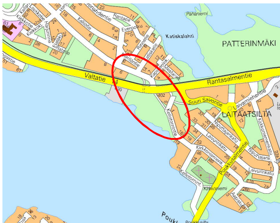
Sijaintikartta, Kellarpellon pellot

Kaava-alue sijaitsee noin kilometrin Laitaatsillasta ja noin 3 km Savonlinnan keskustasta länteen.