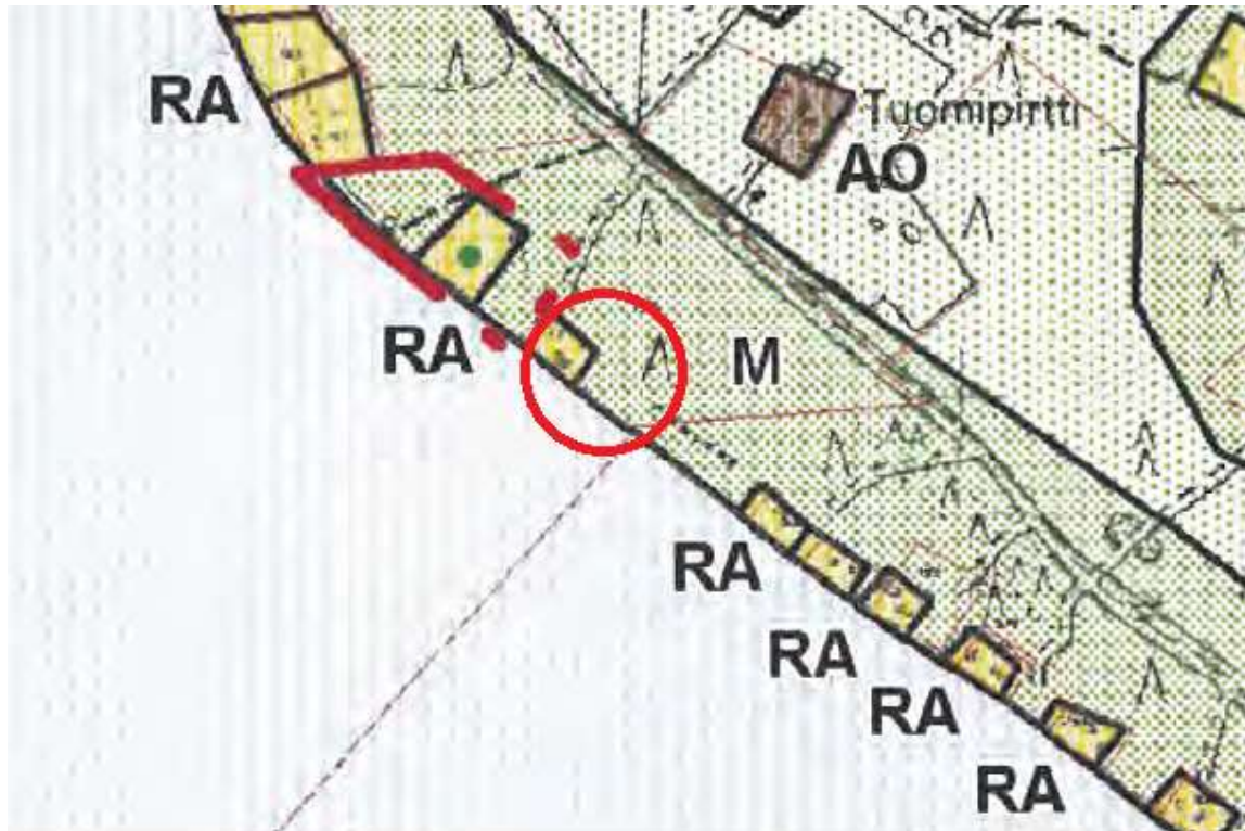
Ote Puruveden rantayleiskaavasta

Alueella on voimassa ympäristöministeriön 15.12.2003 vahvistama rantayleiskaava. Rantayleiskaavassa kaavamuuosalueet on merkitty RA ja M -alueiksi.