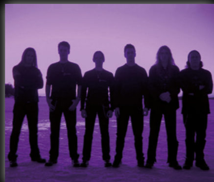
Dark Embraze vuonna 2002

https://www.youtube.com/user/BlightTheBand tästä linkistä löytyy bändin kappaleet täysipitkinä.