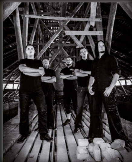
Blight vuonna 2013

Aloitin metalli/hevimusiikin kuuntelemisen noin 12-vuotiaana, soittohommiin ryhdyin 14-vuotiaana, aluksi rumpujen soiton merkeissä ja siitä sitten ryhdyin myös soittamaan kitaraa ja bassoa. Olen niin sanoitusti itseoppinut soittaja, toki mukaan mahtuu pari rumpujen soitonkurssia sekä kitaransoiton kurssi. Soittoharrastamista minulla on takana jo 22 vuotta, siihen mahtuu monia erityyppisiä bändejä, mutta mainittakoon vähän tunnetuimmista bändeistä Dark Embraze sekä Blight, jotka kummatkin ovat julkaisseet levyt 2000-luvulla. Alla kuvia omien bändien levykansista.