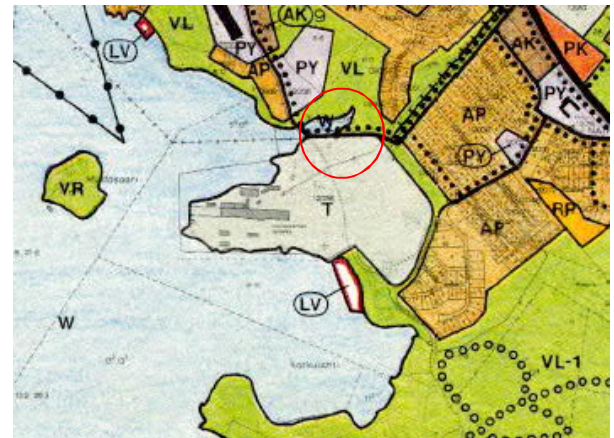
Ote keskustaajaman yleiskaavasta 2000, oikeusvaikutukseton

Oikeusvaikutuksettomassa Keskustaajaman yleiskaavassa alue on teollisuus- ja varistorakennusten korttelialuetta (T).