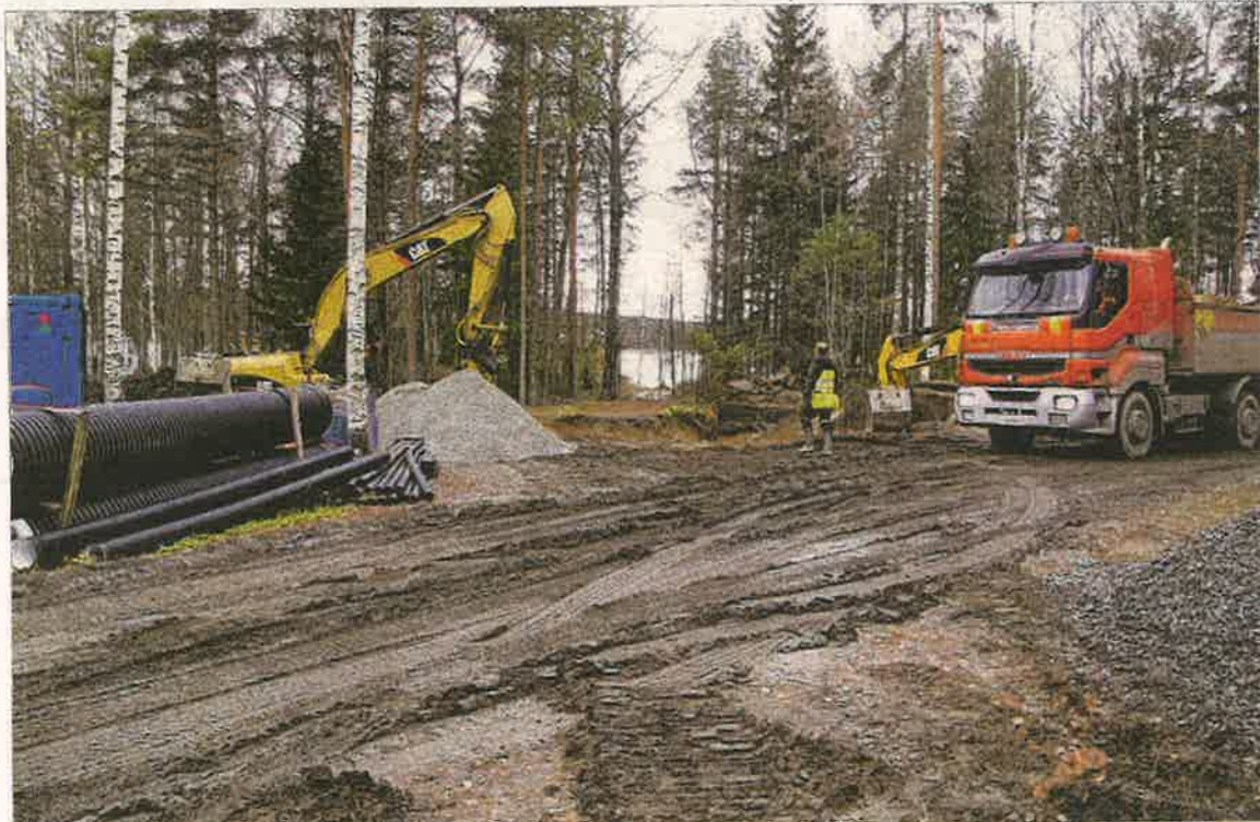
Suutarniemen kunnallistekniikka on parhaillaan rakenteilla.