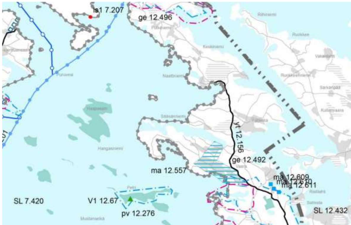
Ote Etelä-Savon maakuntakaavojen yhdistelmästä (2016)

Etelä-Savon maakuntakaavassa (2010, 2016) alueella on kulttuuriympäristön ja/tai maiseman vaalimisen kannalta merkittävä alue ma 12.557 (Vaaran kylä) ja alue rajautuu Puruveden Natura-alueeseen SL 7.420 .