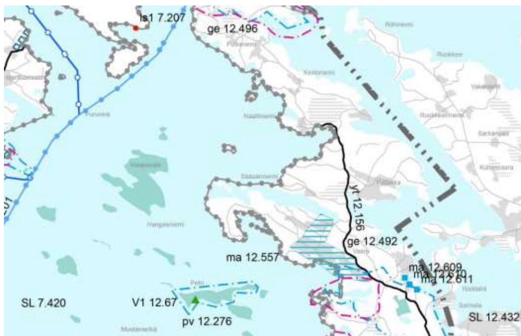
Ote Etelä-Savon maakuntakaavojen yhdistelmästä (2016)

Etelä-Savon maakuntakaavassa (2010, 2016) alueella on kulttuuriympäristön ja/tai maiseman vaalimisen kannalta merkittävä alue ma 12.557 (Vaaran kylä) ja alue rajoittuu Puruveden Natura 2000 –alueeseen SL 7.420 . Kaavamuutoksen tavoitteet eivät ole ristiriidassa maakuntakaavan kanssa.