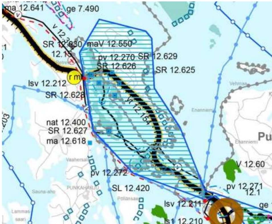
Ote Etelä-Savon maakuntakaavojen yhdistelmästä (2016)

Ympäristöministeriö vahvisti Etelä-Savon maakuntakaavan 4.10.2010 sekä vaihemaakuntakaavat 1. ja 2. vuonna 2016, missä sopimusalue on matkailupalvelujen aluetta rm 12.15 Punkaharjun alue (Ydin: Retretti-Lusto-Kesämaa-Harjualue-Valtionhotelli-Kuntoutuskeskus). Sopimusalueen pohjoispuolella kulkee VT 14 Savonlinnantie (yt 12.154) ja Huutokoski – Parikkala junarata (yr 14.255). Sopimusalue on Punkaharjun pohjavesialueella (pv 12.270) ja valtakunnallisesti avokkaalla maisema-alueella maV 12.550 Punkaharju – Pakkasenharju. Sopimusalueella on maakunnallisesti arvokas Metsätyönjohtajan asunto, mikä sisältyy valtakunnallisesti arvokkaaseen kulttuuriympäristöön SR 12.629 (Punkaharjun tutkimusalue, metsäntutkimuslaitos, RKY 2010, asetus). Lisäksi sopimusalueen läheisyydessä on Punkaharjun Natura-alue (nat 12.400) ja luonnonsuojelualue SL 12.420.