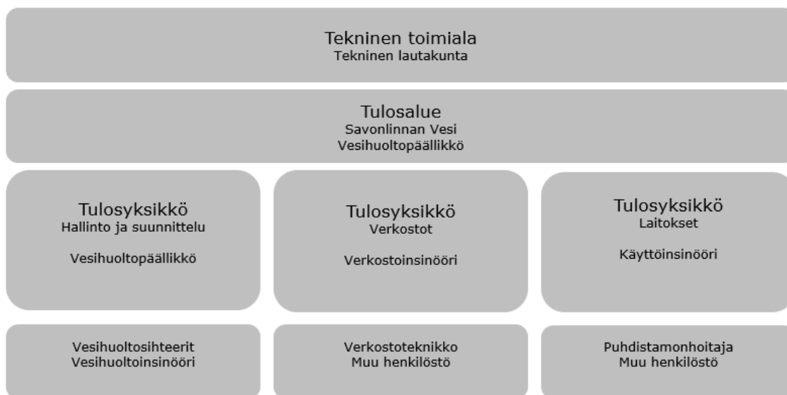
Kuva 4. Savonlinnan Veden organisaatio.

Savonlinnan Veden organisaatio on seuraava: