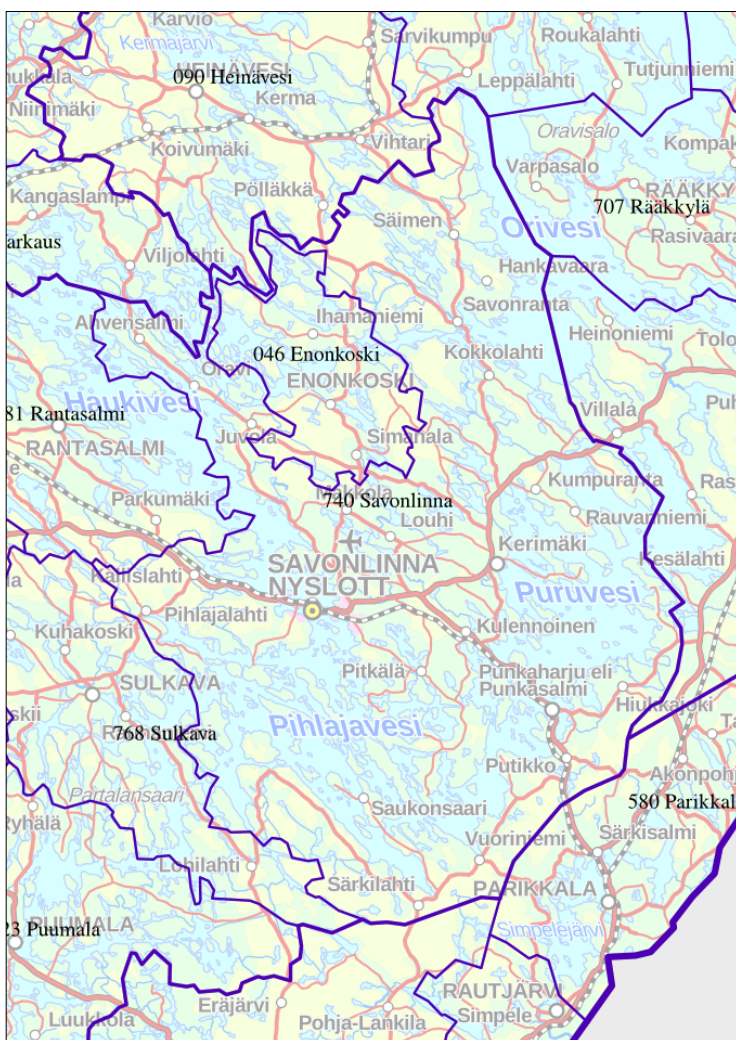
Kuva 1. Savonlinnan kaupunki ja lähikunnat 10 .

Savonlinnan kaupunki sijaitsee Etelä-Savon maakunnan itäosassa. Kaupungin pinta-ala on 3 597 km 2 , josta maa-aluetta on 2 238 km 2 ja vesistöä 1 359 km 2 8 . Naapurikuntia ovat Enonkoski, Heinävesi, Kitee, Liperi, Parikkala, Rantasalmi, Ruokolahti, Rääkkylä, Sulkava ja Varkaus. Kerimäki ja Punkaharju ovat liittyneet vuonna 2013 Savonlinnan kaupunkiin (kuva 1). Savonlinnassa on noin 8 800 kesämökkiä 9 . Savonlinna on sisävesisaaristoinen yksi Suomen kauneimmista kesämökki-paikkakunnista ja matkailukohteista Suur-Saimaan syleilyssä.