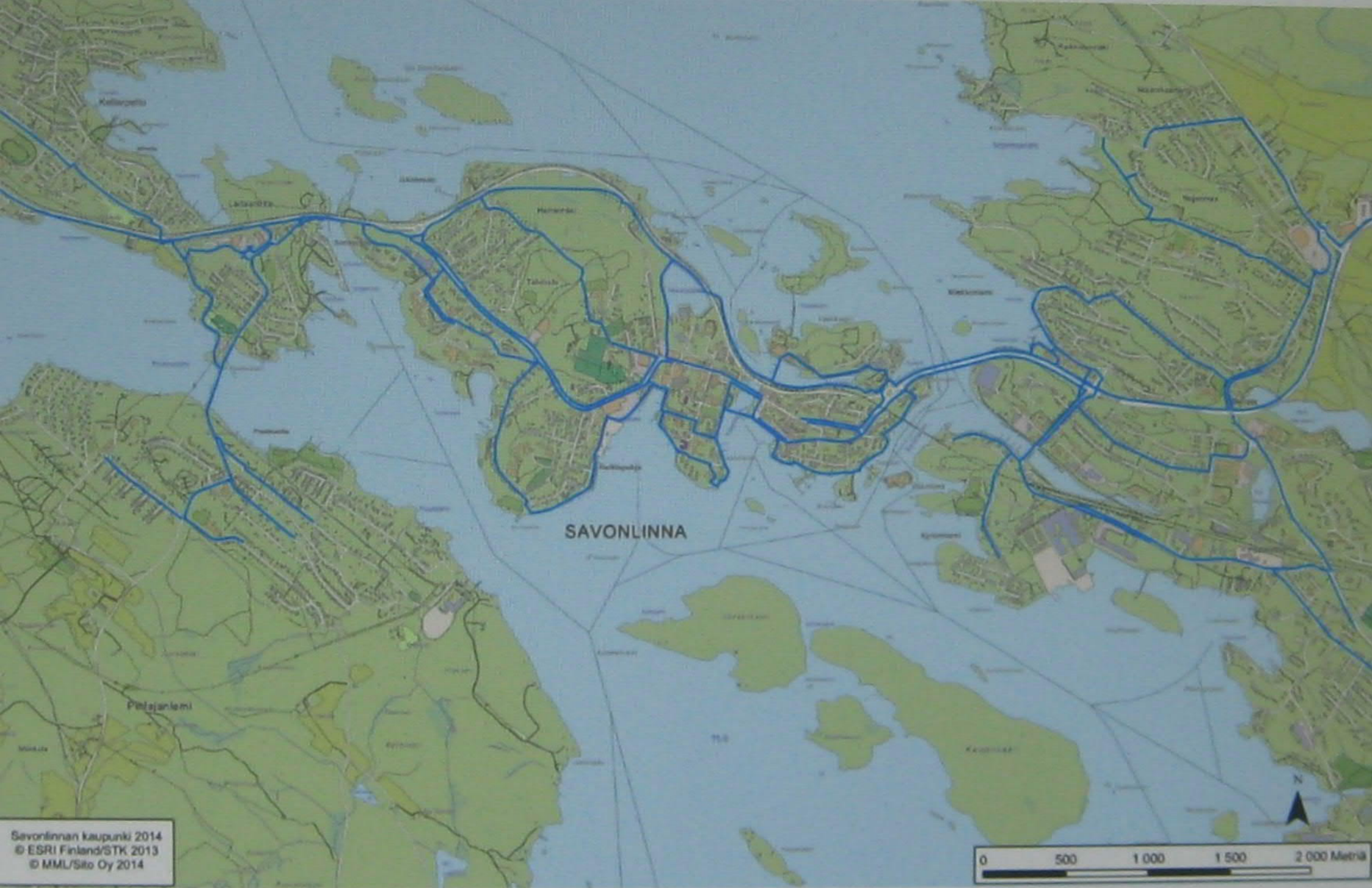
väestökeskittymien pääreitit keskustaajamassa.