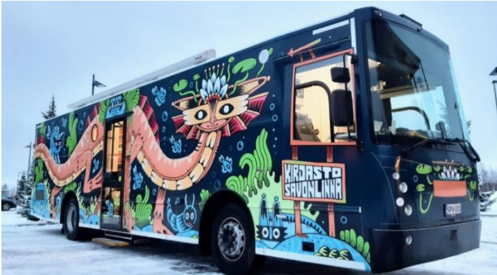
Kuva 3. Uusi kirjastoauto Loisku Lumpehinen aloitti liikennöinnin joulukuussa 2022.