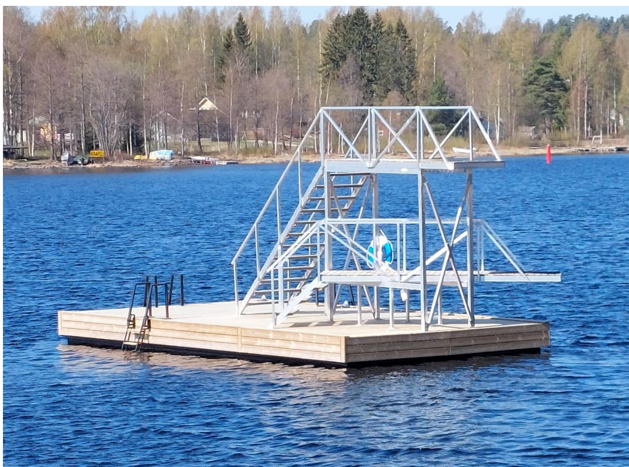
Uimahyppytorni Heikinpohjassa.