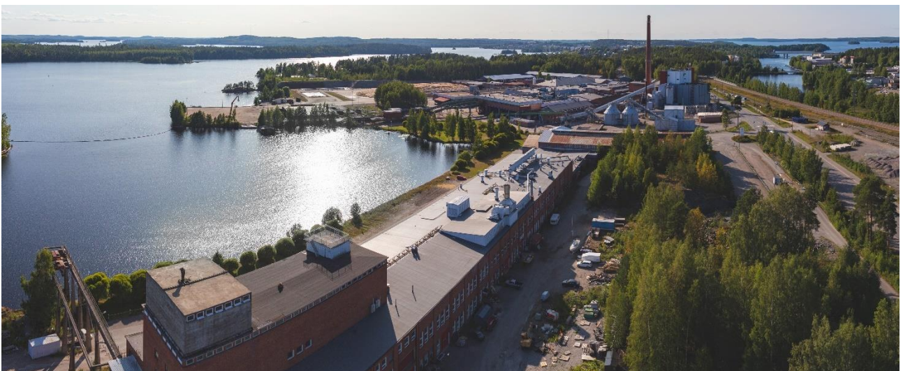
Kuva 4. Yritystalo Schauman ja tehdasalue.

Yhtiöllä on mahdollisuus aloittaa neuvottelut kiinteistön kaupasta.