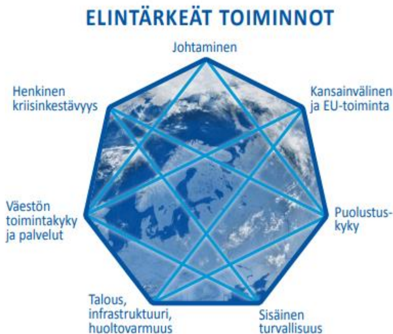
Kuva 2. Yhteiskunnan elintärkeät toiminnot; YTS 2017

Elintärkeät toiminnot ovat yhteiskunnan toimivuuden kannalta välttämättömiä, kaikissa tilanteissa ylläpidettäviä toimintokokonaisuuksia. Yhteiskunnan elintärkeät toiminnot ulottuvat useiden toimijoiden lakisääteisiin tehtäviin ja osin alueille, joille ei voida määritellä yhtä ainoaa vastuutahoa.